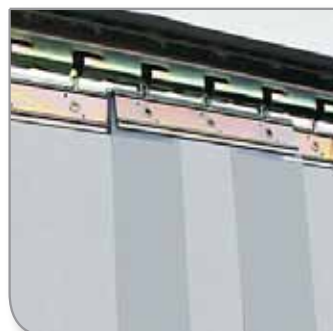
▶ Suspension accroch'matic