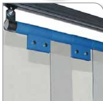
▶ Suspension par brides coulissantes