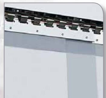
▶ Suspension accroch'inox