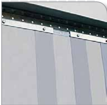
▶ Cornière et contreplaques